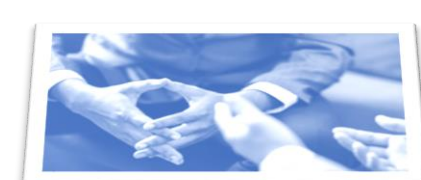
Interactie tussen branches